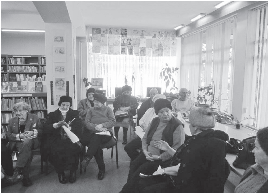
Proiectul se derulează în toate regiunile țării