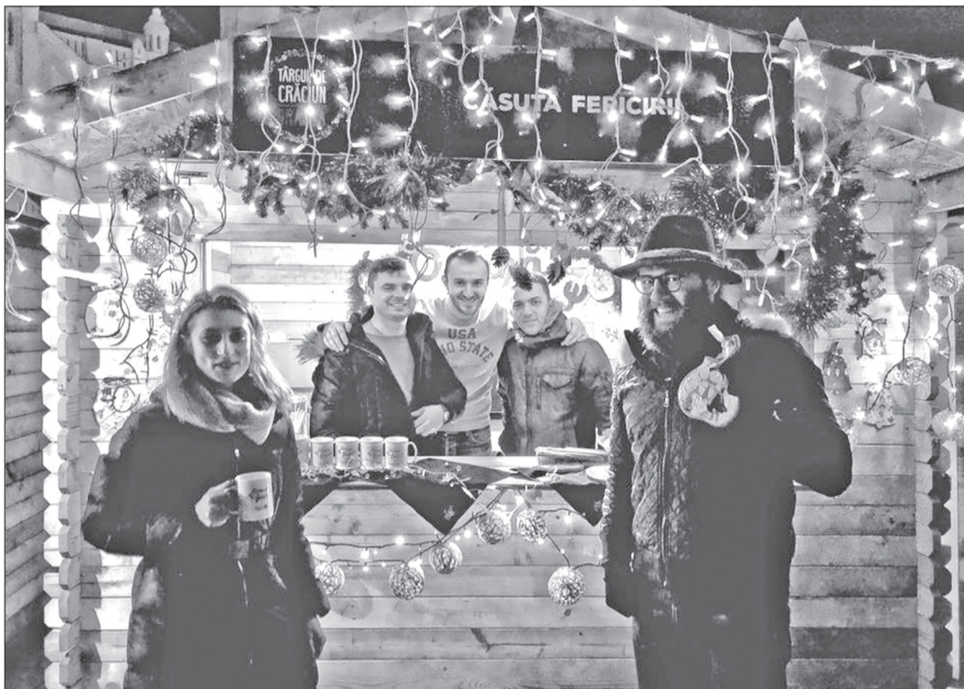
Proiectul este organizat de Rotaract Club Oradea

„Ediția de anul acesta are drept motto „O șansă la viață”, deoarece ne propunem dotarea a două camere din cadrul secției de Oncologie pediatrică a Spitalului Municipal Oradea cu aparate de decontaminare a aerului. Astfel, beneficiarii direcți ai proiectului din acest an sunt copiii cu risc major de