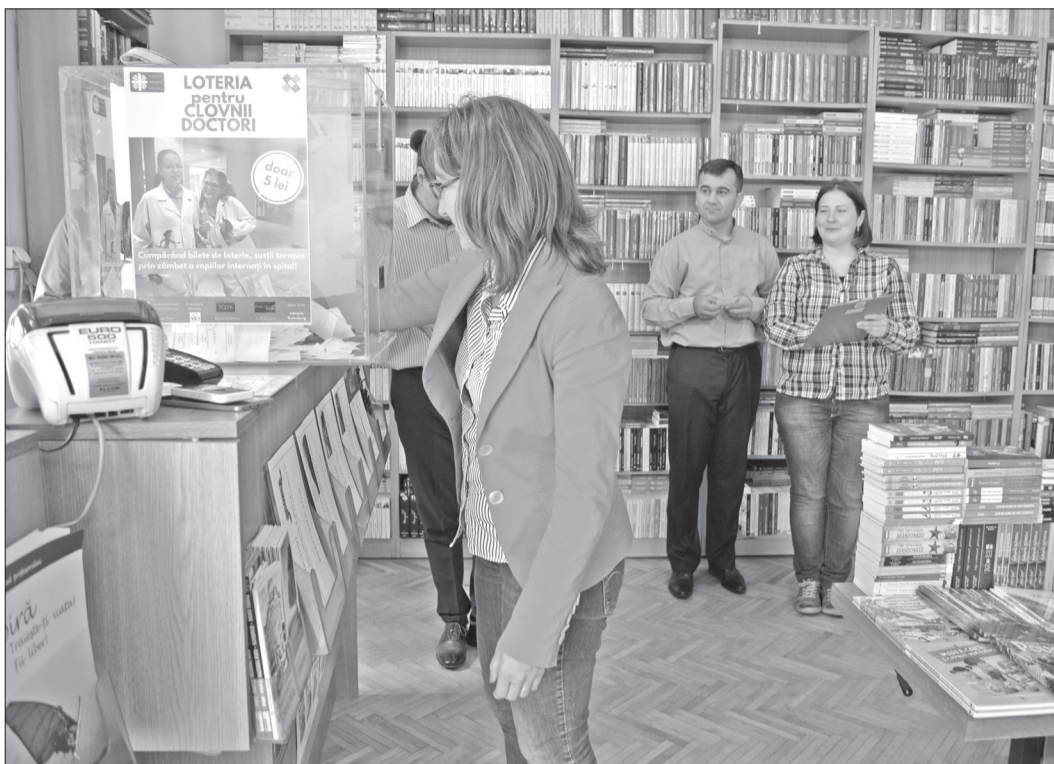
Extragerea premiilor Loteriei a avut loc joi, 25 mai, la Bibliotecă Gutenberg