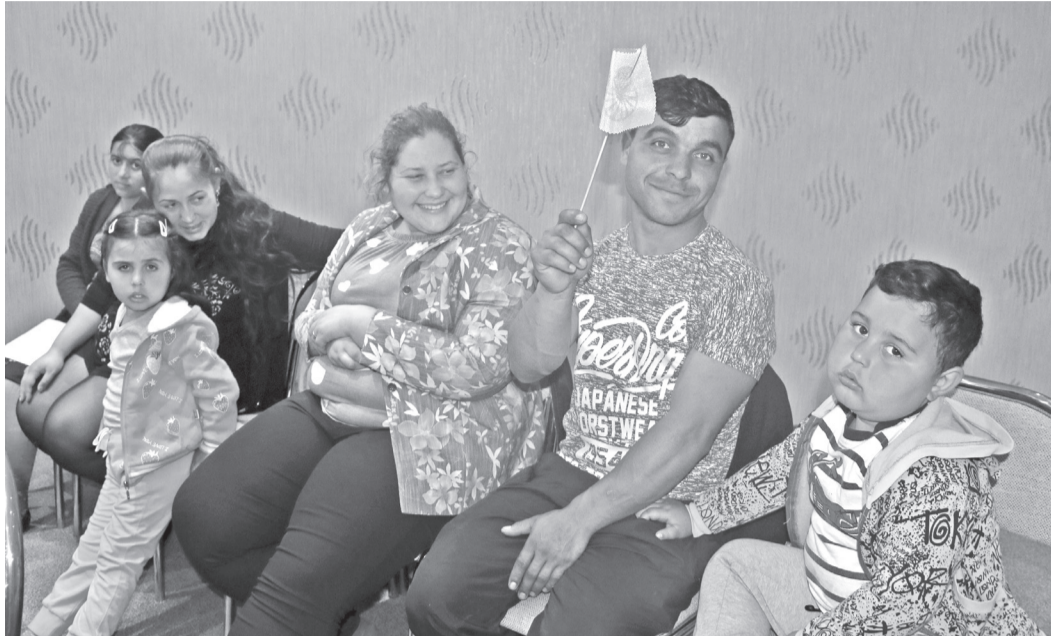
Evenimentul s-a desfășurat la Hotel Continental