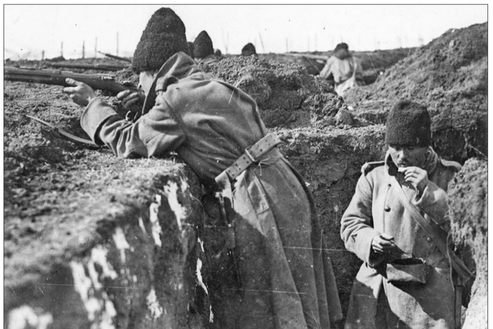
Soldați români în tranșee, toamna anului 1916