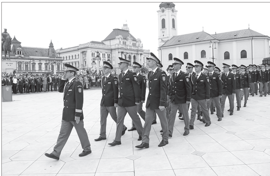
Actuala promoție este formată din 263 de absolvenți