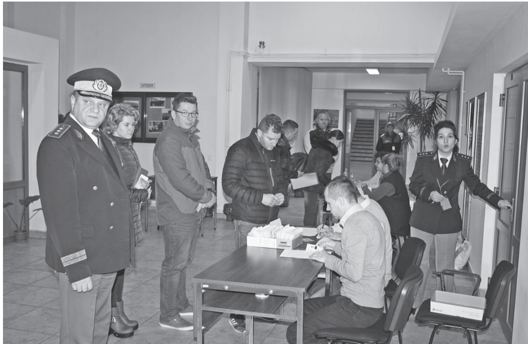
Azi se desfășoară proba la limba română

Din cele 280 de locuri, cinci sunt destinate cetățenilor români de etnie romă și trei altor minorități. Din cei 1.309 candidați recrutați care și-au finalizat dosarele până la data de 22.12.2017, s-au prezentat la sediul școlii și s-au înscris la concurs un număr de 1.248, 791 băieți și 456 fete. După susținerea probelor eliminatorii, respectiv vizită medicală și