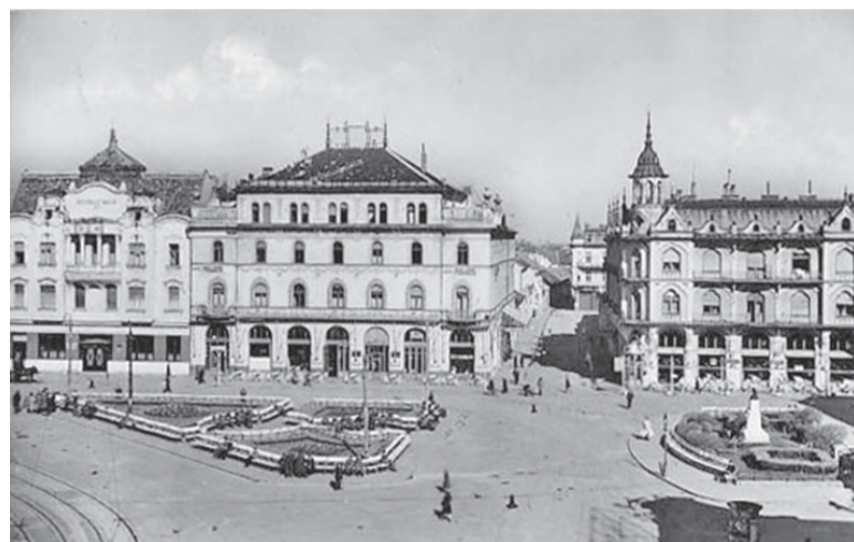
Oradea în preajma Primului Război Mondial

(Mircea Mușat, Ion Ardeleanu, De la statul geto-dac la statul român unitar , București, 1985, p. 607).