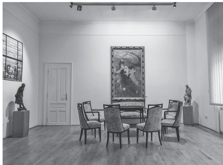
Interior din Muzeul Memorial Aurel Lazăr din Oradea