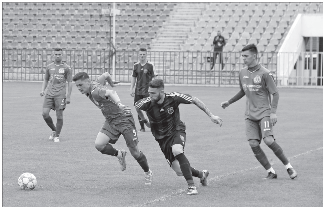
Lucașfăruș Oradea și-a propus să atace promovarea în noul sezon