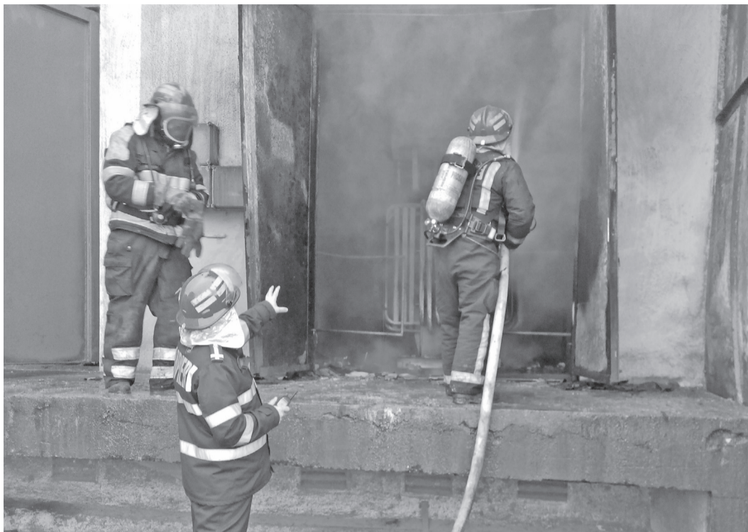
Instalațiile electrice defecte și improvizările sunt cauza principală a incendiilor

În cursul anului 2016, pompierii militari din cadrul unității și subunităților Inspectoratului pentru Situații de Urgență „Crișana” al județului Bihor au acționat pentru stingerea a peste 100 de incendii provocate de astfel de împrejurări determinante, iar în luna ianuarie a acestui an, echipajele de pompieri au intervenit pentru localizarea și lichidarea a 14 incendii având cauze probabile similare celor menționate (11 incendii provocate probabil de instalații electrice defecte, două incendii generate de aparate electrice lăsate sub tensiune nesupravegheate și un incendiu cauzat de echipamente electrice improvizate), ultimul dintre acestea producându-se în data de 29 ianuarie a.c., la o locuință din localitatea Urvind. În acest context, Inspectoratul pentru Situații de Urgență „Crișana” reamintește cetățenilor măsurile ce trebuie respectate pentru preîntâmpinarea unor astfel de evenimente nedorite, soldate în unele cazuri cu mari pagube materiale și uneori chiar cu pierderi de vieți omenești. Verificați integritatea aparatelor și mijloacelor de încălzire electrice, iar în cazul în care acestea sunt defecte, reparați-le cu ajutorul unui specialist sau cumpărați-