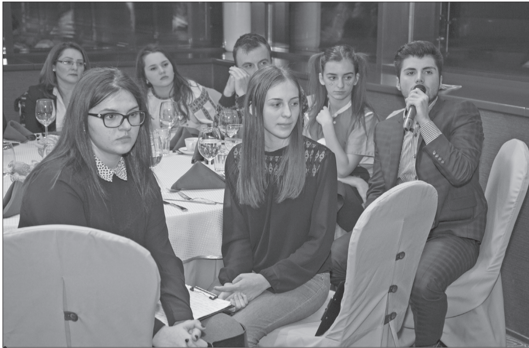
În cadrul evenimentului s-au adunat peste 100 de mii de lei

că din cadrul evenimentului a fost prezentarea celor șase proiecte selectate la ediția a IV-a a programului Bursa Talentelor.