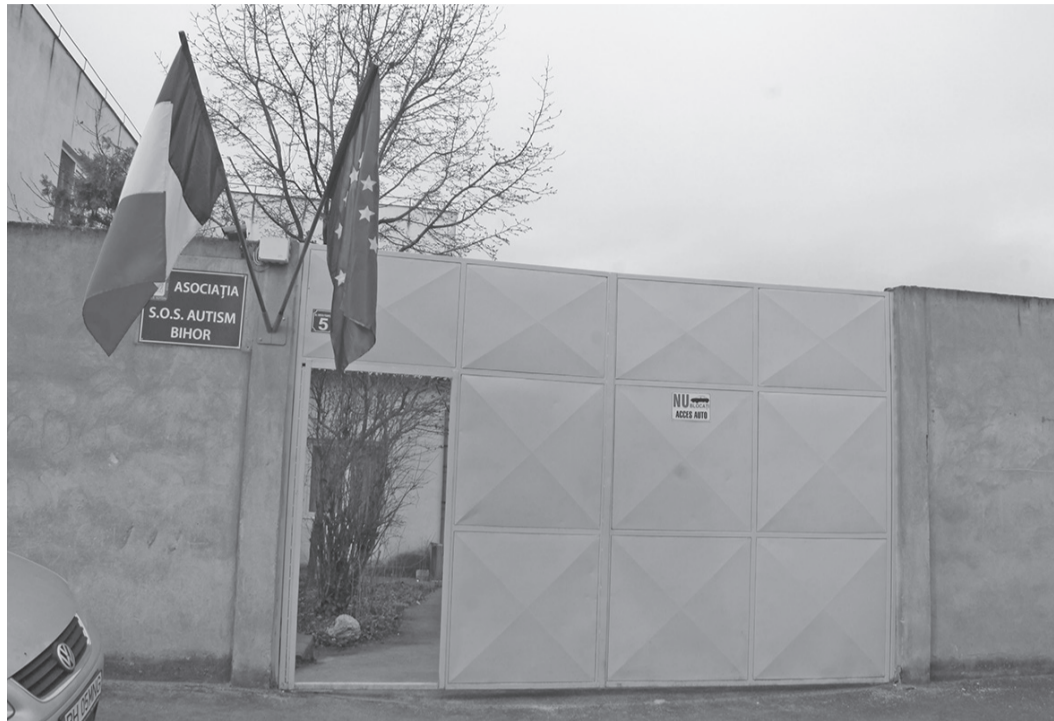
E primul an în care Asociația funcționează într-un spațiu nou