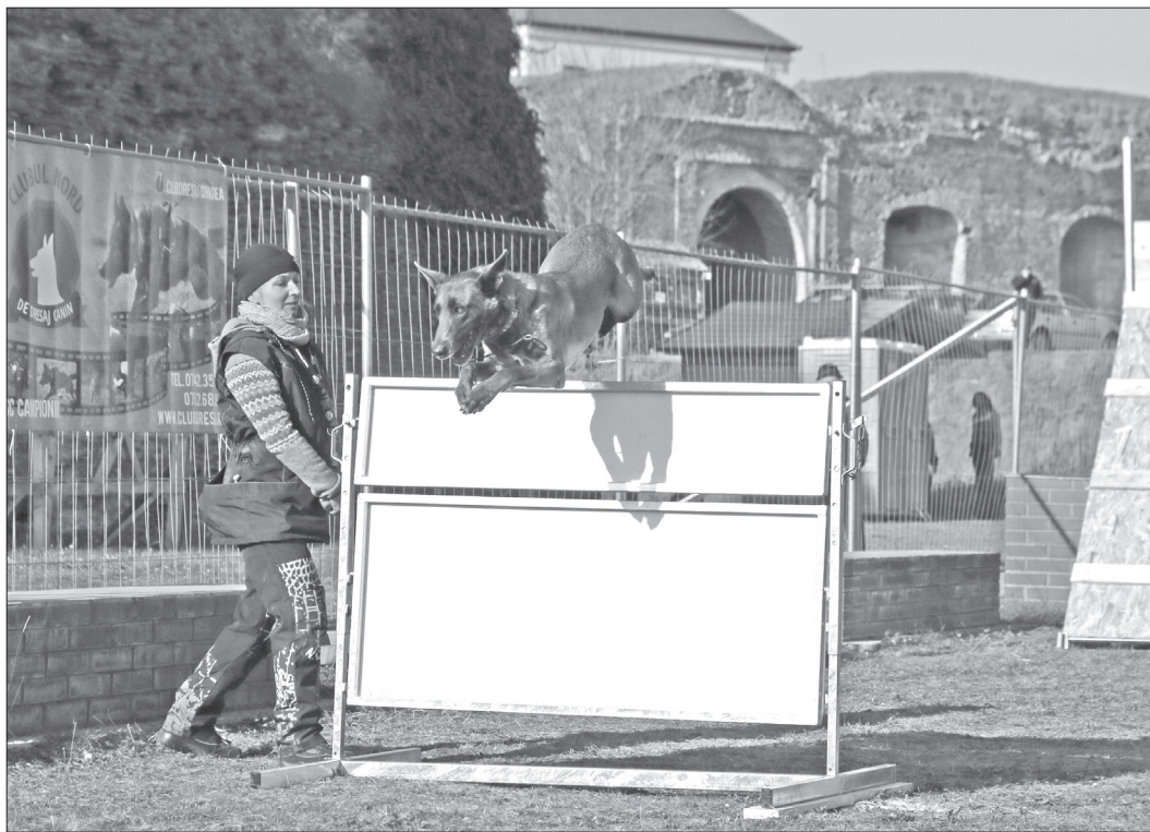
În concurs au intrat în jur de 30 de participanți

„Sportul acesta este Formula 1 în dresajul canin. Intri cu un câine, fără lesă, fără zgardă și câinele acela trebuie să lucreze perfect în condiții pe care nu le cunoaște. Am avut în jur de 30 de participanți, în cele două zile, pe toate categoriile, din Rusia, Cehia, Slovacia, Austria și România. Este prima ediție a unei competiții a Clubului de ciobănești belgieni și olandezi, în colaborare cu Clubul Național de Mondioring, la Oradea. La aceste competiții există mereu ceva nou, pentru că toate sunt inedite: tema concursului, aranjamentele pe teren, scenariile etc. De fiecare dată există ceva nou”, a