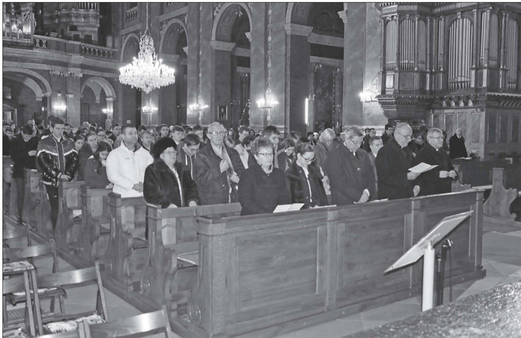
Culte din Oradea se străduiesc să facă pași înainte în colaborarea dintre ele

Săptămâna de rugăciune pentru unitatea creștinilor va continua în perioada 22-29 ianuarie, după următorul program: azi, 22 ianuarie, de la ora 18.00, la Biserica Reformată Rit, bulevardul Ștefan cel Mare nr. 6; mâine, 23 ianuarie,