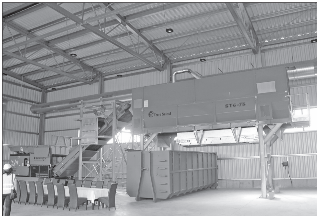
Stația de sortare va deservi întreg județul

Stația de tratare mecano-biologică, situată în Episcopia, lângă halda de gunoi ecologică, are ca obiectiv reducerea la depozitare a cantităților de deșeuri biodegradabile. Valoarea contractului de execuție a lucrării a fost de 27 de milioane lei fără TVA și a prevăzut construirea unor hale de primire și pretratare, o zonă de biostabilizare, un șopron de maturare, alimentarea cu apă, dotări cu echipamente și construirea clădirii administrative. Noua facilitate este parte a unui proiect de care vor beneficia aproape 500.000 locuitori din județul Bihor, ai căror reprezentanți, în baza deciziilor a 101 consilii locale, au adunat unitățile administrativ-teritoriale din județ într-o singură asociație, Asociația de Dezvoltare Intercomunitară Ecolect Bihor, care va asigura, după implementare, funcționarea sistemului de management integrat al deșeurilor. Prin im-