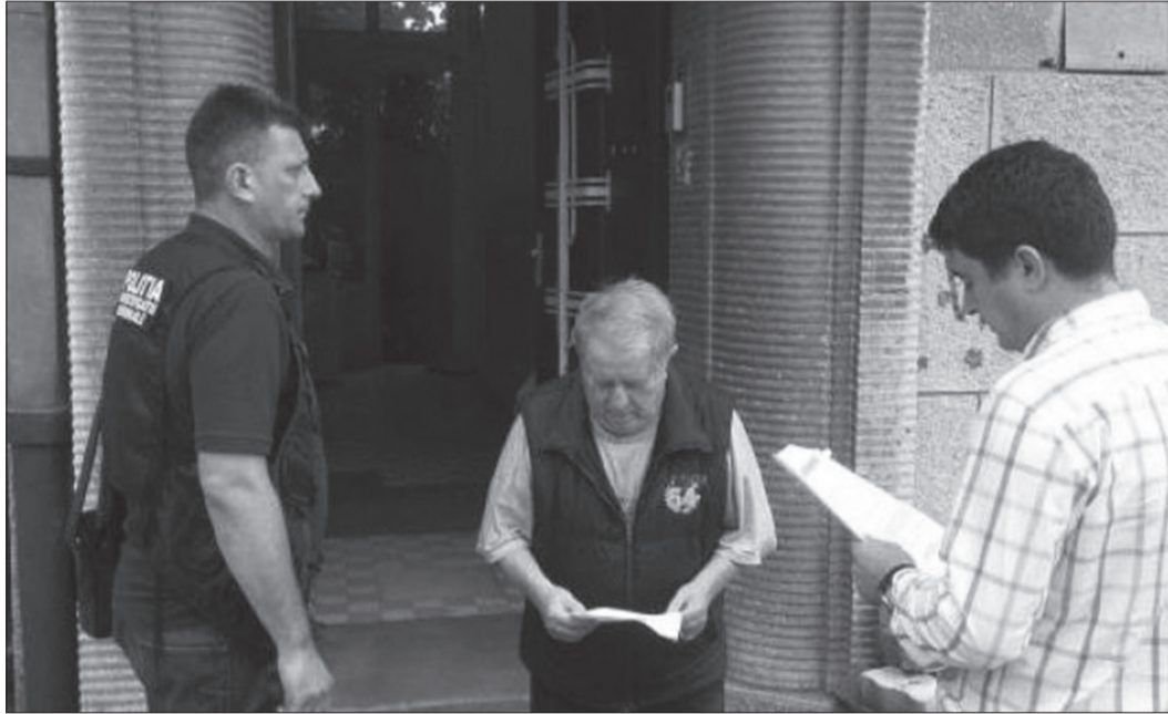
În anchetă sunt cercetate 36 de persoane

„Mai multe cadre didactice din cadrul unor instituții de învățământ superior desfășoară activități ilegale constând în pretinderea și primirea unor