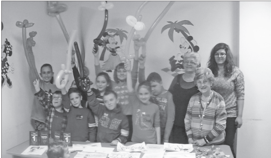
Activitățile se derulează sâmbătă de sâmbătă în Orașelul Copiilor